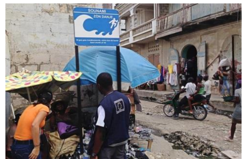
Un técnico de ECHO visitando una zona costera donde la población vive bajo la amenaza de tsunamis.

Desde 1998 , la Comisión ha invertido 32,5 millones EUR para que Haití tenga más capacidad de resiliencia ante los desastres, a través del programa de Preparación ante Desastres de ECHO ( DIPECHO ) y de actividades de reducción del riesgo. La financiación ha permitido establecer sistemas de alerta temprana y mejorar los refugios y las infraestructuras para hacer frente a los desastres que se repiten, tales como huracanes e inundaciones. De los 1,5 millones de haitianos desplazados por el terremoto, el 90 % se encuentra en la actualidad reubicado. Pero los que aún viven en los campamentos son los más vulnerables . El programa DIPECHO para el periodo 2015-2016 dedicará 3 millones EUR para acciones de preparación ante desastres en el país.