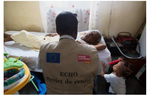
Una persona mayor se beneficia del programa de ayuda al alquiler para dejar el campamento.

El catastrófico terremoto de magnitud 7.0 que azotó el país en enero de 2010, desencadenó una respuesta humanitaria masiva. En la fase de emergencia, la financiación de la UE ayudó a proporcionar refugio, agua potable, asistencia sanitaria, alimentos, protección y artículos básicos a cerca de 5 millones de personas . Se establecieron hospitales móviles mientras se rehabilitaban las instalaciones sanitarias que habían sido destruidas. Entre 2010 y 2014, la respuesta del departamento de Ayuda Humanitaria y Protección Civil de la Comisión Europea (ECHO) ayudó a un total de 1,3 millones de personas en los campamentos , facilitando el acceso a servicios de primera necesidad y a una infraestructura de asistencia sanitaria básica.