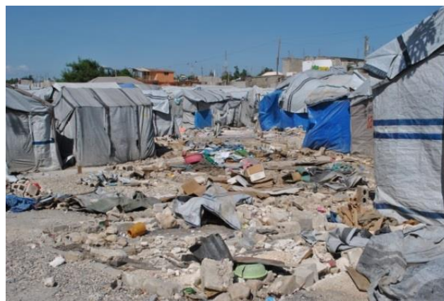
Los servicios básicos en los campamentos siguen siendo muy insuficientes.

Aunque se ha producido un progreso significativo desde el terremoto de 2010, todavía persisten necesidades humanitarias relevantes. Los servicios básicos, la protección y las soluciones de alojamiento adecuadas siguen siendo muy insuficientes para las personas desplazadas. Cinco años después, más de 60 000 haitianos siguen alojados en 45 campamentos de refugiados para personas desplazadas internamente, donde el acceso al agua y a los servicios básicos continúa siendo muy limitado (cifras del OIM y del DTM de julio de 2015). Los haitianos desplazados internamente son el grupo de población más vulnerable, ya que en los campamentos se enfrentan a unas condiciones de vida muy malas.